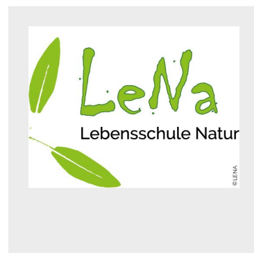
LeNa Lebensschule Natur